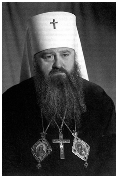
Митрополит Никодим (Ротов) 1929–1978

Митрополит Никодим (Ротов) также настоятельно рекомендовал наставникам Академии защищать диссертации, а однажды даже взял объяснительные с нескольких доцентов за то, что они за десять лет преподавания так и не представили магистерских работ 33 . Сам же владыка Никодим в этом деле был примером и образцом. В 1969 г. Совет Ленинградской академии уже присудил ему докторскую степень, минуя степень магистра, по совокупности трудов 34 . Однако