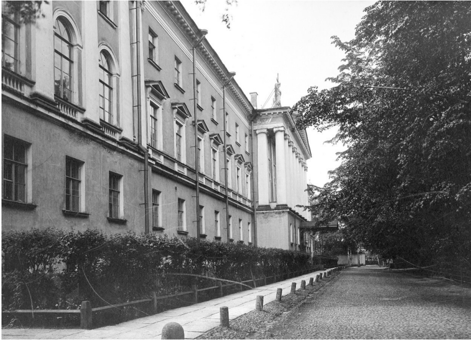
Бывшее здание Санкт-Петербургской Духовной Академии

кнута сводился к тому, что в Академии невозможно было преподавать, не получив степень магистра.