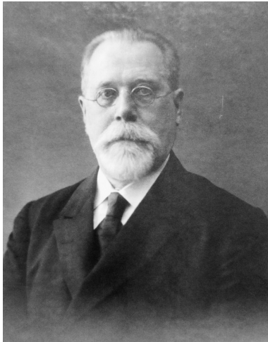
Николай Никанорович Глубоковский (1863–1937)

духовных школ Русской Православной Церкви в 2012 г. Санкт-Петербургская академия в итоговом рейтинге заняла первое место 39 . Вторым доказательством служат многочисленные не только статьи, но и монографии наставников Академии 40 , общими усилиями которых удалось добиться включения в декабре 2015 г. академического журнала «Христианское чтение» в перечень ВАК 41 .