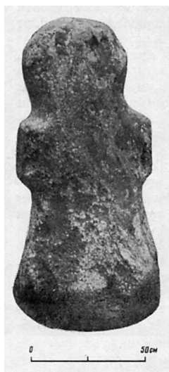
Рис. 3. Средневековый каменный крест с обломанными боковыми лопастями из д. Велье Псковской области (Александров А.А. О следах язычества на Псковщине // Краткие сообщения Института археологии Академии наук СССР. № 175. М., 1983. С. 15–16. Рис. 5–1).

Для затронутого здесь вопроса особое значение имеет антропоморфное каменное изваяние, найденное в конце XIX в. в окрестностях Пскова, близ устья р. Промежица. А.Н. Кирпичников соотнес эту находку с известием побывавшего в Пскове в 1590 г. немецкого путешественника Иоганна Давида Вундерера (Johan David Wunderer) о «двух идолах», располагавшихся в ту пору «перед городом», около остатков полевого лагеря Стефана Батория 1581 г. Исследователь отметил, что «о жрецах Вундерер упоминает в давно прошедшем времени. Очевидно, что ко второй половине XVI в. святилище было заброшено или казалось таковым». Тем не менее, по мнению А.Н. Кирпичникова, «сообщение Вундерера о кумирах под Псковом позволяет реконструировать святилище, которое, возможно, почти семь веков находилось в окрестностях города» и лишь в самом конце XVI в. было уничтожено «в пору ужесточения борьбы христианства с языческими верованиями» 26 .