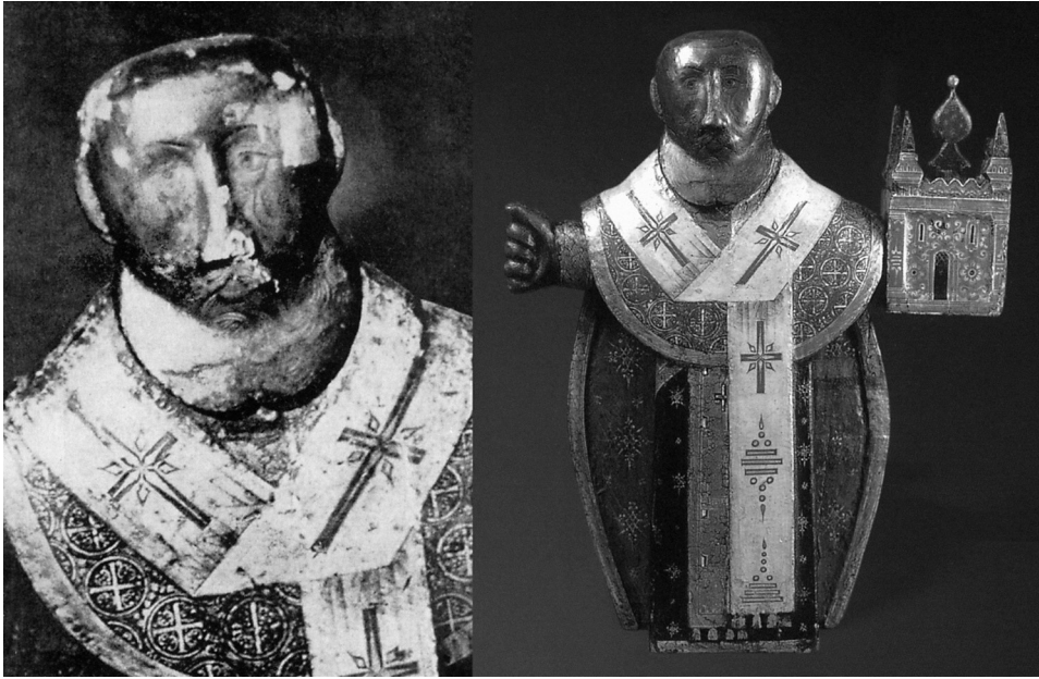
Рис. 1. Скульптура «Св. Николай Можайский» (дерево, темпера, высота — 51 см); Русский Север. XVII в., Государственный музей истории религии. Слева — Успенский Б.А. Филологические разыскания в области славянских древностей. (Реликты язычества в восточнославянском культе Николая Мирликийского.) М., 1982. Илл. VII (вклейка). Справа — Сокровища музея истории религии. К 300-летию Санкт-Петербурга. СПб., 2003. С. 21.

замещения восточнославянских языческих богов христианскими святыми: «...Иерархическое место Николы становится вполне понятным, если предположить, что отношения Бога и Николы... отражают отношения Перуна и Волоса, которые, в свою очередь, генетически представляют собой ипостаси Бога Грозы и его противника» 5 .