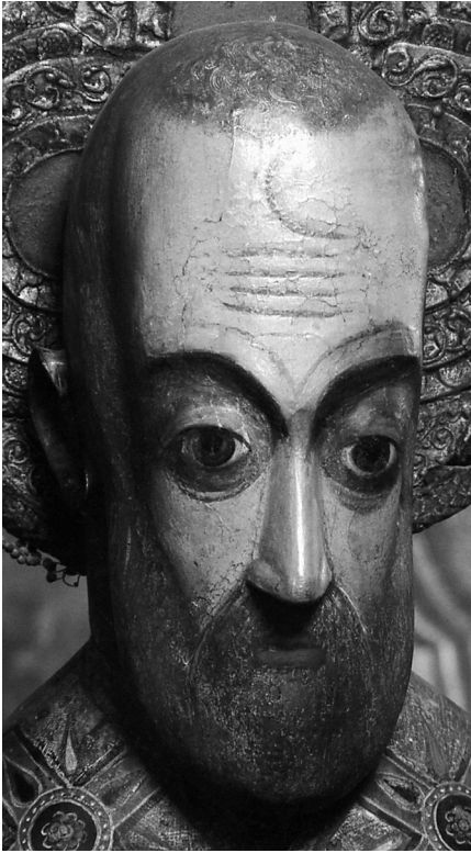
Рис. 2. Лик скульптуры «Св. Николай Можайский» (дерево, темпера, высота лика — около 45 см); с. Покча Пермской области, конец XVII — начало XVIII вв., Пермская государственная художественная галерея (Пермская деревянная скульптура. Пермь, 1985. С. 54–55. Рис. 22).

XVII в. de visu 12 (рис. 1) заставляет признать подобные ассоциации беспочвенными, а точнее — обусловленными такой концептуальной направленностью воображения, при которой последнее, по словам Н.М. Карамзина, «во всей своей бурной стремительности... не давало разуму отчета в путях своих» 13 . Попутно здесь следует также отметить мнение А.К. Чекалова о связи другой деревянной фигуры св. Николая Можайского «с невероятно длинной головой и птичьими глазами» — из церкви с. Покча Пермской области — «с образами людей-оборотней древних прикамских изваяний» 14 . Однако, думается, что и в данном случае видение орнитоморфных черт в датируемом концом XVII — началом XVIII вв. резном изображении мирликийского святителя (рис. 2) оказывается следствием определенного рода «инерции» восприятия подобных скульптур. И, например, О.М. Власова описывает покчинское изваяние совершенно иначе — как «одно из самых сложных произведений поздней христианской