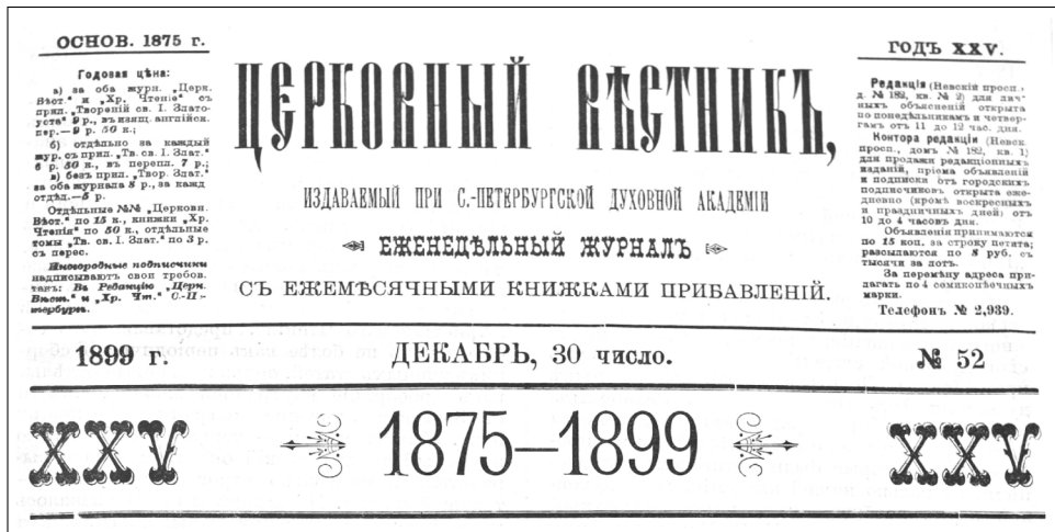
Рис. 2. Часть обложки юбилейного номера «Церковного вестника» № 52 за 1899 г. (Празднование 25-летия издания)

На период редакторства А.П. Лопухина пришлось празднование 25-летия «Церковного вестника». Торжества прошли в конце 1899 г. Последний № 52 «Церковного вестника» за 1899 г. был посвящен празднуемой дате. В юбилейном выпуске были опубликованы статьи, посвященные обстоятельствам возникновения и развития журнала. Особое внимание уделено редакторской деятельности А.И. Предтеченского, А.Л. Катанского, Н.А. Скабалановича, А.П. Лопухина. Особый интерес представляет таблица распространения «Церковного вестника» и «Христианского чтения» по епархиям в 1899 г. Из приведенной статистики следует, что в 1899 г. «Церковного вестника» было разослано 7079 экз., а «Христианского чтения» — 4650 экз. 79 Редакция академических журналов в лице профессора А.П. Лопухина даже обратилась к читателям со словами благодар-