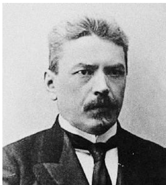
С. И. Поварнин (1870–1952)

смысловой акцент Поварнина, сделанный им на проблеме отношений между суждениями. Причем отношения между подлежащим и сказуемым представляют собой у Поварнина отношения действительного мира, которые осознаются человеком и осуществляются в речи.